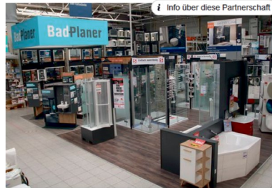
Beispielkampagne von OBI