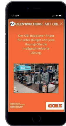
Beispielkampagne von OBI